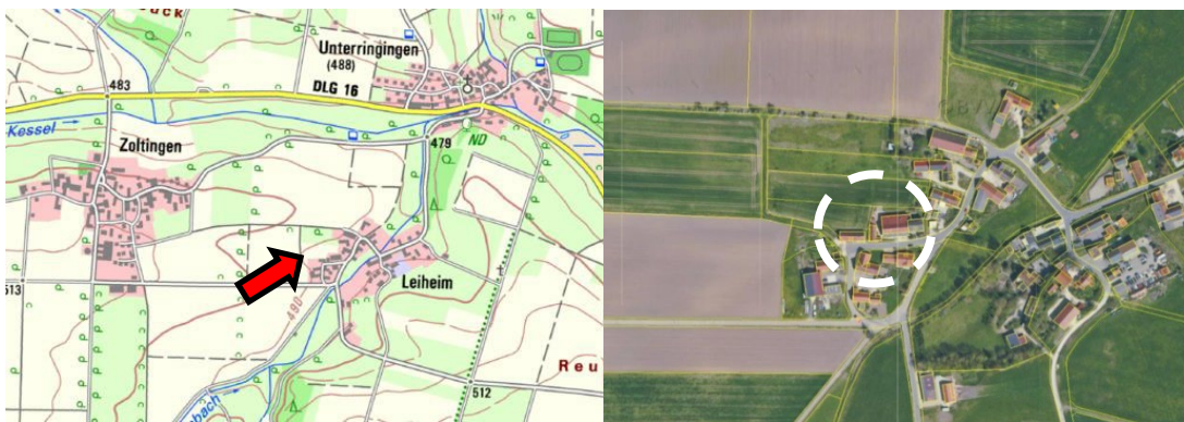
Topographische Karte und Luftbild mit Grundstücksgrenzen (ohne Maßstab), Quelle: Bayernatlas.de

In Einschätzung zu den formulierten Satzungsinhalten und laut allgemeiner festgesetzter Planungsdimension sowie nach realem Biotopraum ist davon auszugehen, dass der Untersuchungsraum für die Artenschutzprüfung auf den Geltungsbereich zu beschränken ist, angrenzende Bereiche des Vorhabens subaltern erwogen werden müssen, sodass insgesamt keine erweiterte Arealfäche zu betrachten ist.