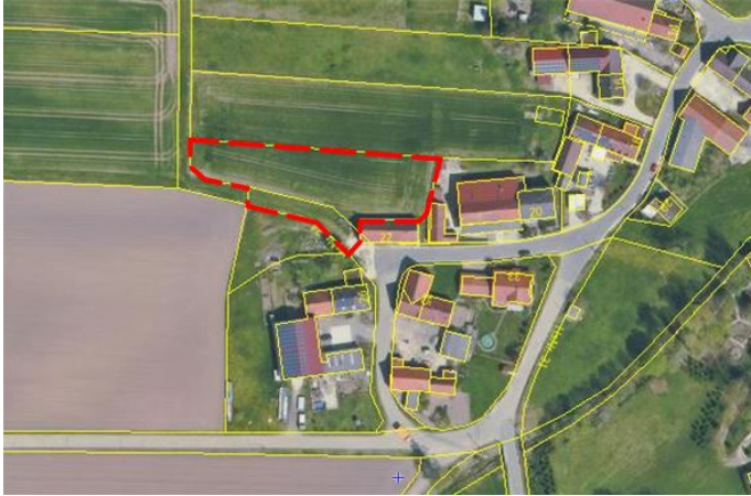
Abbildung Luftbild Plangebiet (rot umrandet)

Der Geltungsbereich gliedert sich in eine offene Agrarzone (Ackerkultur) und einen unbefestigten landwirtschaftlichen Anwandweg an der Ortsrandlage im Übergang in die offene Feldflur.