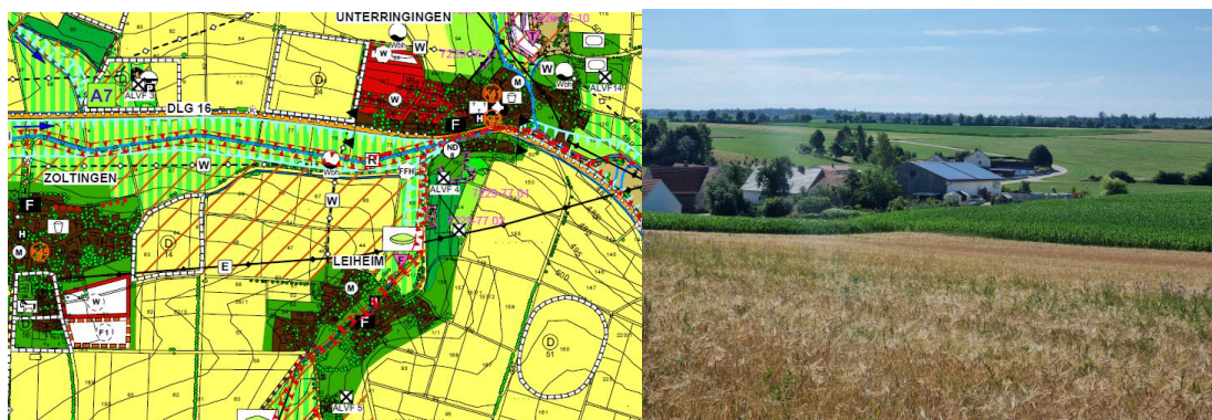
Ausschnitt Karte FNP und Fotoaufnahme 07/2022 von Nordwest (ohne Maßstab)