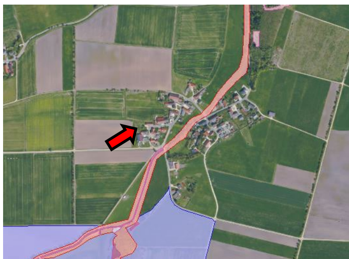
Abbildung Schutzgebietskulisse

Der Planraum liegt im Einzugsgebiet des oberen Kesseltales. Im Geltungsraum sind keine Biotope kartiert. Das FFH-Gebiet ID 7229-371 „Kessel mit Kessel, Hahnenbach und Köhrlesbach“ mit dem Anteilsraum Köhrlesbach (- Durchfluss des Baches durch die Ansiedlung-) als auch der Biotopbereich ID 7229-1080-002 „Hochstaudenflure am Köhrlesbach südwestlich von Leiheim“, stehen zum Vorhabenbereich in distanzierter Lage.